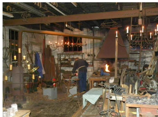
Interieur begane grond