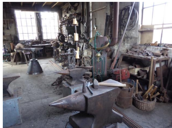
Interieur begane grond